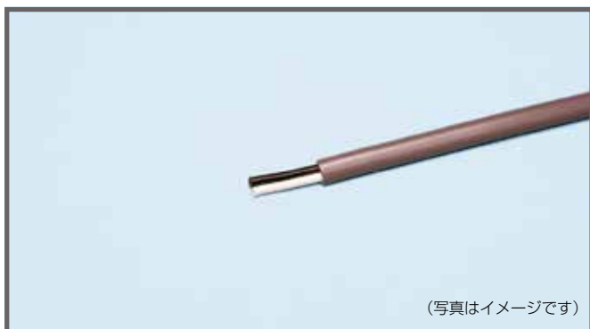
(写真はイメージです)