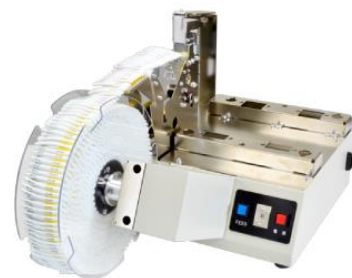
チューブストッカー ST1