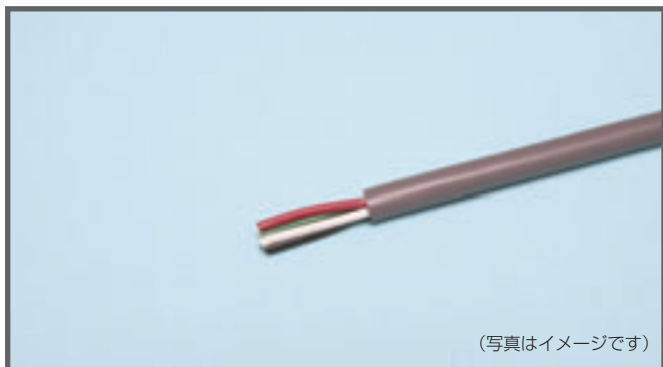
(写真はイメージです)