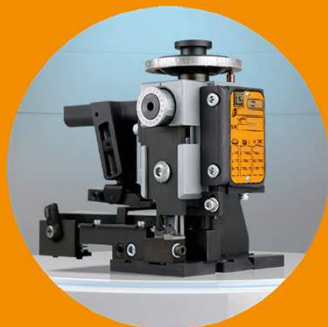
アプリケータ各種