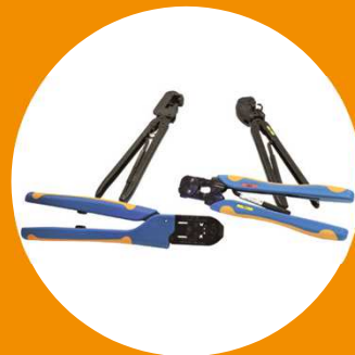
ハンドツール各種